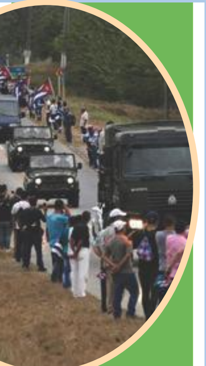
కడసారి చూపు కోసం నిద్రలు మాని ప్రహారీ గోడలపై ఎదురు చూపు

అనగ్గులు అంక్షలు తట్టుకొని 99.8 శాతం అక్షరాస్యతను సాధించింది. 30వేల మంది డాక్టర్లు 40 పేద దేశాలకు, 50 వేల హెల్త్ వర్కర్లు 66 దేశాలకు పంపింది. 2015లో తల్లి నుంచి బిడ్డలకు హెల్త్ బాధ సోకకుండా జాగ్రత్తలు తీసుకున్న మొదటి దేశం. ప్రపంచంలో మొదటిసారి మహిళా సైనికులను ఆయన ఏర్పాటు చేశారు. మహిళలు మరంత బాధ్యతలను, క్రమశిక్షణతోనూ పనిచేస్తారని మహిళానియా మకాలను వ్యతిరేకిస్తూ ప్రశ్నించిన వారికి ధీమాగా జవాబు చెప్పారు. ప్రస్తుతం మనదేశంలో సహా అనేక దేశాలు ఈ బరపడిని అందిస్తున్నాయి. ఆ చిన్న దేశంలో వ్యభిచారం ఉండదు.. ప్రతిమహిళా విద్యార్థిని చూడాలి.. దేశ ఉత్పాదకరంగాలలో తన శక్తిని పెట్టుకుని వినియోగిస్తారు. పురుషులతో దాదాపు సమానంగా గౌరవించబడే ఒక్క కమ్యూనిస్టు మాత్రమే.. ఒక్కమాటలో చెప్పాలంటే కాన్ట్రోల్ ఈ శతాబ్దపు మహోన్నత వ్యక్తి.. అణచివేతలుంటే తిరుగుబాటులుంటాయని, సమ సమాజం నిర్మితమయితే ఉగ్రవాదానికి చోటుండదని తన ప్రతి క్రియతోనూ చాటిన యుగపురుషుడు కాన్ట్రోల్.. - బోస్