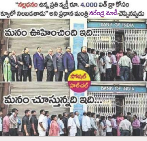
నమ: అనుకోవడం మినహా ఏమీ చేయలే... ఆంధ్రాచూడే వేరు... ప్రపంచంలో ఎక్కడ ఏ గొప్ప జరిగినా నేనే కారణం అని చెప్పి ఏమీ సీఎం చంద్రబాబునాయుడు.. నవంబర్ 8 నుంచి ఇప్పటి వరకు మూడు రకాల పల్లవిని అందుకున్నారు. ఇకటి నోట్ల రద్దును నేనే కారణం అనేది మొదటి మాట ప్రజల్లో వచ్చిన వ్యతిరేకత కోత్త పాట మొదలెట్టారు. చిల్లర సమస్య పరిష్కారించాలని. ఇదెలాగూ తప్పనిసరిగా చేయాల్సి అంతం. సో ఈ సునత ఆయన భావాలలో వడిపోవాలి కావలసింది. ఇప్పుడు మరో చరణం అందుతున్నాయి. రెండు రోజుల్లో నగదు రహిత లావాదేవీలు చేయాలని, ప్రస్తుతం నెలకొన్న నోట్ల కొరత సమస్యను సులభంగా అధిగమించే ఏకైక మార్గం నగదు రహిత చెల్లింపులే. ఇప్పుడు ఇదే విషయమై ప్రభుత్వం విస్తృత ప్రచారం చేపట్టింది. ప్రజలతో జరిపే లావాదేవీల్లో ఈ పోస్, స్ట్రెస్ మిషన్లు వాడుతుండటం. వ్యాపార, వాణిజ్య సంస్థలు ఈ మిషన్లువాదాలకు ఇక్కడ వచ్చిన ప్రస్తావన లేకుంటే ఆయన బాబు ఎలా అవుతారు. రేషన్ షాపుల్లోనూ బియ్యం కోసం డెబిట్ కార్డులు, డెబిట్ కార్డులున్నవారు రేషన్ షాపులకు ఎందుకు వెళ్తుంటే బాబుకే తెలియాలి.