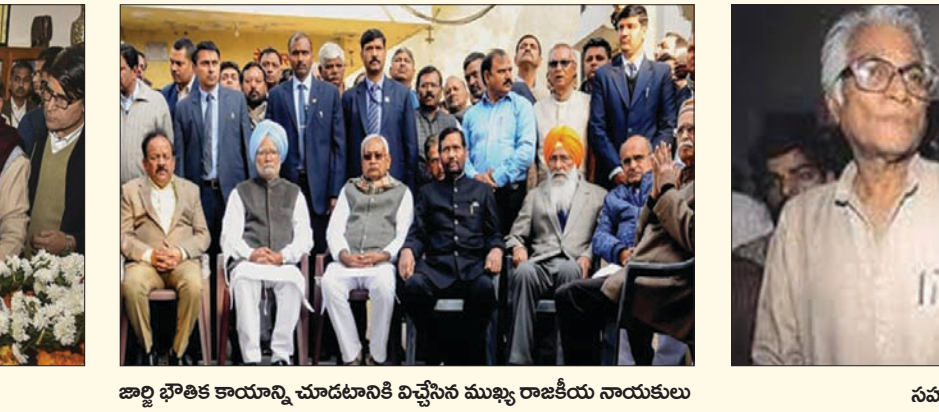
జార్జి భౌతిక కాయాన్ని చూడటానికి విచ్చేసిన ముఖ్య రాజకీయ నాయకులు