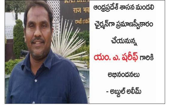
ఆంధ్రప్రదేశ్ శాసన మండలి చైర్మన్ గా ప్రమాణస్వీకారం చేయనున్న యం. ఎ. షరీఫ్ గారికి అభినందనలు - అబ్దుల్ అలీమ్

అమరావతి సంపుటి : 4 సంచిక 20, పేజీలు 4, వెల: రూ. 2.00 ఆంధ్రప్రదేశ్ 'రాజధాని' తొలి తెలుగు వార పత్రిక సోమవారం 4 - ఆదివారం 10 ఫిబ్రవరి, 2019