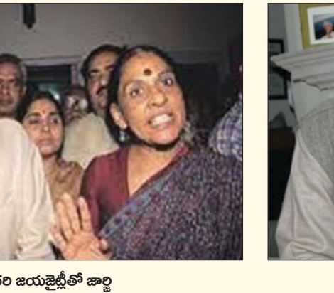
సహచరి జయజైల్లో జార్జి