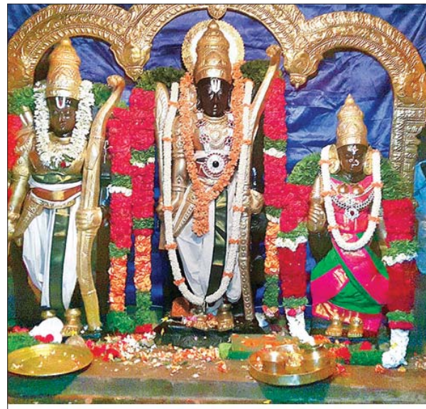
సీతాలక్షణ నమోత ఒంటిమిట్ట తోరణరామయ్య