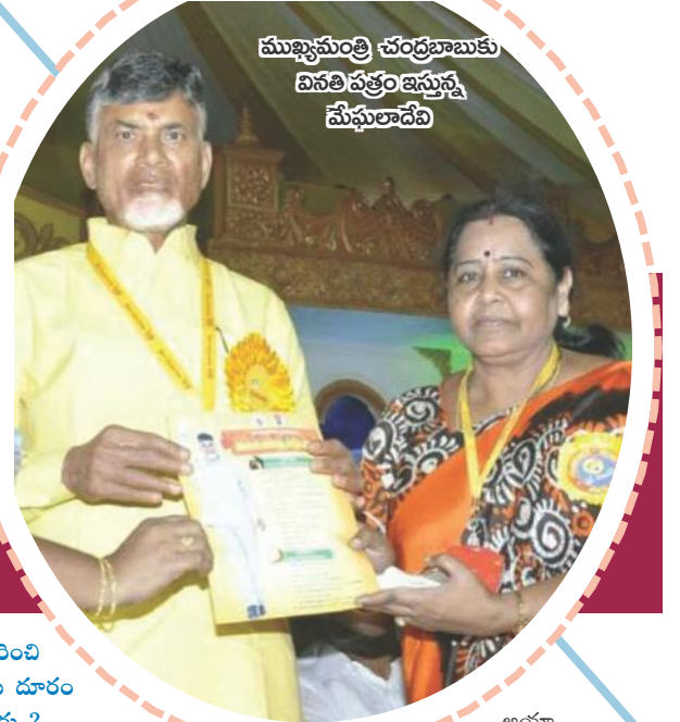
ముఖ్యమంత్రి చంద్రబాబుకు వినతి ప్రత్యంజన్య మేఘలాదేవి