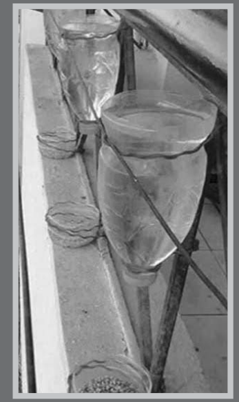
పక్షులకు నీళ్లు, ఆహారం అందించి వాటిని కాపాడండి