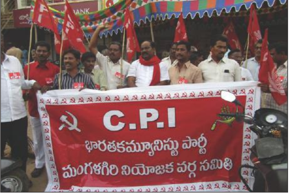
నోట్ల రద్దుకు నిరసనగా ధర్నా చేస్తున్న సీపీఐ నాయకులు

రాజధాని ప్రతినిధి-మంగళగిరి: ప్రధానమంత్రి సరేంద్ర మోడి వెయ్యి రూపాయలు, రూ.500/-ల నోట్లను రద్దు చేసి అనేక మంది పేదల ప్రాణాలను బలిగొన్నాడని సరేంద్రమోడీపై హత్యానేరం కేసు నమోదు చేయాలని సి.పి.ఐ. జిల్లా కార్యదర్శి జంగాల అజయ్ కుమార్ డిమాండ్ చేశారు. మంగళగిరిలో సోమవారం మంగళగిరి సి.పి.ఐ. పార్టీ ఆధ్వర్యంలో రూ.500/-, 1000/- నోట్ల రద్దు చేసే రూ.2000/-ల నోట్లను విడుదల చేయాలన్న నిరసనూ పట్టణంలో ర్యాలీని, ధర్నాను చేశారు. ఈ ర్యాలీ సి.పి.ఐ. కార్యాలయం నుండి ఆంధ్రాబ్యాంకు వరకు కొనసాగింది. ఆంధ్రా బ్యాంక్ లో నిరసనను వ్యక్తం చేశారు. బ్యాంకుకు వచ్చిన ఖాతా దారులకు మోసాన్ని వివరించారు. అనంతరం బ్యాంక్ ముందు ధర్నాను చేశారు. ఈ సందర్భంగా జంగాల అజయ్ కుమార్ మాట్లాడుతూ సరేంద్ర మోడి