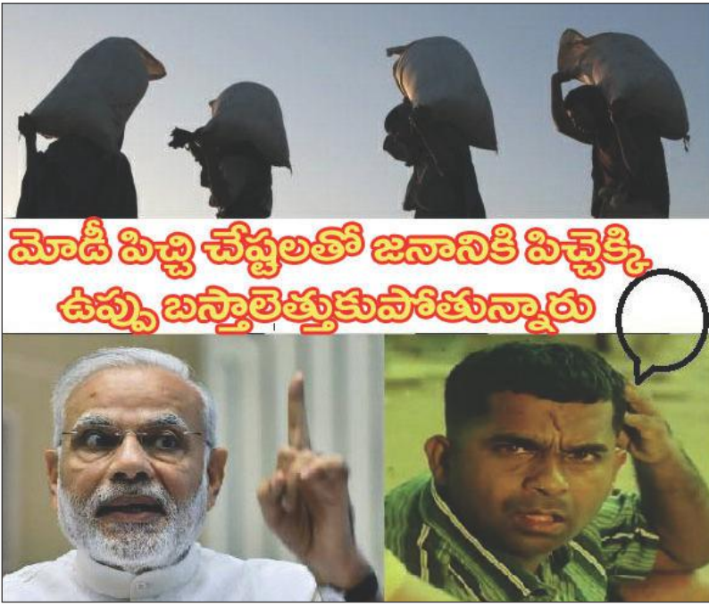
మోడీ పట్టు చేష్టలతో జనానికి పిచ్చెక్కి ఉప్పు బస్తాలెత్తుకుపోతున్నారు