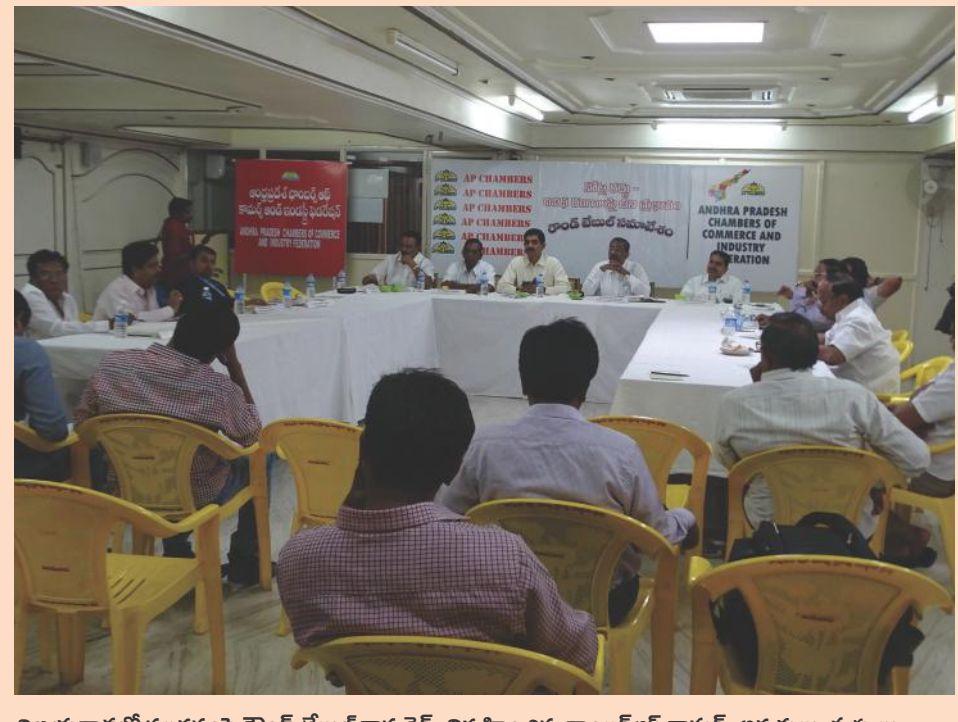
విజయవాడలో నల్లదంపి రౌండ్ టేబుల్ కాన్ఫరెన్స్ నిర్వహించిన ఛాంబర్ ఆఫ్ కామర్స్ అధ్యక్షులు, సభ్యులు

విగ్రు మార్తమే ఉన్నారు. వై.ఎస్.ఆర్.కాంగ్రెస్ పార్టీకి చెందిన మరొకందరు కౌన్సిలర్లు కూడా టీడిపిలో చేరబోతున్నట్లు ఊహాగానాలు వస్తున్నాయి.