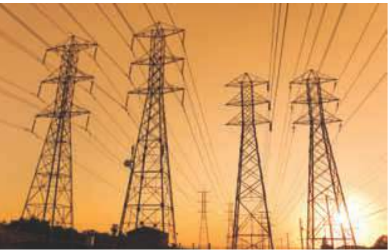
గ్రామాల్లో ఉన్న కొస్తాలు, పవర్ గ్రీడ్ టవర్ లైన్లపై

ఆర్వి ప్రతినిధి : రాజధాని ప్రాంతంలోని భూమి లేని నిరుపేదలకు ప్రభుత్వం రూ. 2500 పింఛన్ ఇవ్వాలని నిర్ణయించిన విషయం తెలిసిందే. అయితే ఆఫీసులపై డిఆర్డీఏ సిబ్బందితో సిఆర్డీఏ అధికారుల పర్యవేక్షణలో రూ 2500 పింఛన్ లబ్ధిదారులపై సర్వే నిర్వహించారు. వ్యవసాయ భూమి లేనివారిని ఈ జాబితాలో చేర్చారు. రాజధాని ప్రాంతంలోని 29 గ్రామాల్లో సుమారుగా 35 వేల మంది ఉన్నారని డిఆర్డీఏ సర్వే ఫలితాల ద్వారా ప్రకటించారు. అనంతరం తుది జాబితా సర్వేలో 25 వేల మంది అని పేర్కొన్నారు. ఇటీవల సిఆర్డీఏ కమిషనర్ సుమారు 17,500 భూమి లేని నిరుపేదలు ఉన్నారని ప్రకటించారు. మళ్ళీ 16,500 మంది మాత్రమేని సిఆర్డీఏ అడిషనల్ కమిషనర్ చెప్పకేళ్ళు తెలిపారు. అసలు 13 వేల మంది జాబితా మాత్రమే సిఆర్డీఏ అధికారుల వద్దకు చేరడం విశేషం. అదేమని అడిగితే ఇంకా తుది సర్వే జాబితా విడుదల కావాలని ఉందని సెలవిస్తున్నారు. ఇదే క్రమంలో ప్రభుత్వం సుమారుగా 22 వేల మంది లబ్ధిదారులకు రూ 2500కి పింఛన్ ఇచ్చేందుకు నిధులు విడుదల చేసినట్లు ప్రకటించింది. సీఎం చంద్రబాబు మాటలకు, సిఆర్డీఏ అధికారుల మాటలకు ఎక్కడా పొంతన కుదరకపోవడంతో ఈ లెక్కలు, జాబితాలు పేదలకు వరాలగా మారతాయో, శాపాలుగా మారతాయో అర్థంకాక ఆందోళన చెందుతున్నారు. అంకెల గారడీ ఆపి అసలు లెక్కలు తేల్చాలని ఇప్పటికైనా అర్హులు జాబితాలను పంచాయతీ కార్యాలయాల వద్ద ప్రజలకు అందుబాటులో ఉంచాలని వారు కోరుతున్నారు. ఇదే క్రమంలో ఏదైనా కారణాల వల్ల అర్హత జాబితాలో పేరులేని వారు తిరిగి సత్కరం విచారణ జరిపేమకుని అర్హత పొందేలా అధికారులు ఏర్పాటు చేయాలని లబ్ధిదారులు కోరుతున్నారు.