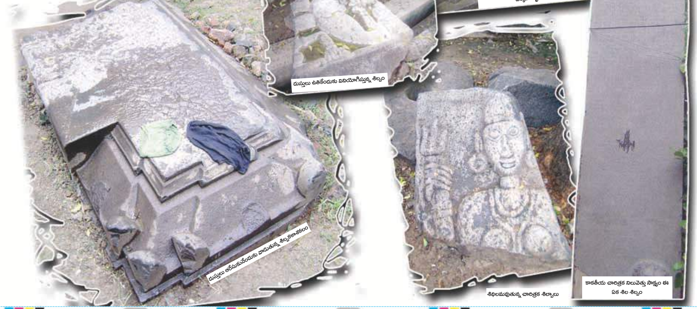
దుస్తులు ఉతికేందుకు వినియోగిస్తున్న శిల్పం