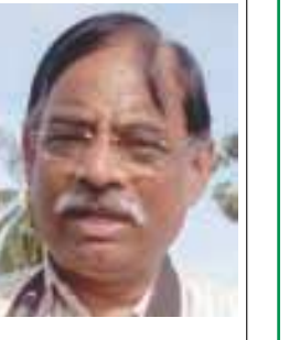
అశ్వనీకుమార్ పరీడా, అటవీశాఖ స్పెషల్ చీఫ్ సెక్రటరీ

అకు పచ్చని లోకంలాంటి నవరాజధాని సీఎం చంద్రబాబు నాయుడు మానస పుత్రిక. ఈ రాజధానిలో బహుళ అంతస్తుల కంటే ముందే అందమైన ఉద్యానవనాలు వాసాలని, అందమైన పర్యావరణం ఉండాలని సీఎం సలహా. దీంతో పాటు పేదలకు ఉపాధి అవకాశాలు మెరుగు పడాలని సీఎం కోరుకుంటున్నారు. ఆయన ఆశయం నెరవేర్చేందుకు అటవీశాఖ చిత్తశుద్ధితో కష్టపడుతోంది. ఉపాధి కలిపే దేశగా ప్రజాశక్తిల నిర్ధార చేస్తున్నాం.