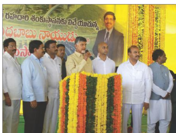
సీడ్ క్యాపిటల్ రహదారికి శంకుస్థాపన చేసిన అనంతరం మాట్లాడుతున్న సీఎం చంద్రబాబు

రాజధాని ప్రతినిధి, వెలగపూడి, తుళ్లూరు : సీడ్ క్యాపిటల్ రహదారికి ముఖ్యమంత్రి చంద్రబాబునాయుడు శనివారం శంకుస్థాపన చేశారు. తుళ్లూరు మండలం వెంకటపాలెం వద్ద రూ.215 కోట్ల వ్యయంతో నిర్మించనున్న రహదారికి శంకుస్థాపన చేసిన అనంతరం ముఖ్యమంత్రి మాట్లాడారు. సీడ్ క్యాపిటల్ కు అనుసంధానంగా విజయవాడ వారి నుంచి భోరుపాలెం వరకు సీడ్ యాక్సిస్ రోడ్డును నిర్మిస్తున్నట్లు చెప్పారు. అంతర్జాతీయ ప్రమాణాలతో నిర్మించే రహదారి నిర్మాణానికి ప్రతి ఒక్కరు సహకరించాలని ఆయన కోరారు. రాజధాని రహదారుల అభివృద్ధిలో పాటు ఈ ప్రాంత ప్రజానీకం అన్ని రంగాల్లో ఎదగాలని ముఖ్యమంత్రి ఆకాంక్షించారు. రహదారి నిర్మాణం 9 నెలల్లోగా పూర్తి చేయాలని కొంత ప్రాంతాలను ఆదేశించారు.